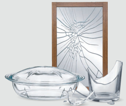
Fensterglas, Spiegelglas, Bruchglas, Kristallgläser, feuerfestes Glas