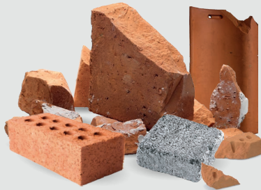
Bauabfälle wie Backsteine, Marmorplatten, Beton, Steine, Ziegel