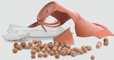
Keramik, Geschirr, Tongefäße, Blumentöpfe, Blähton (Lecca-Kugeln)